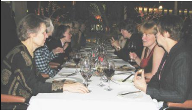
Juhlailillisella ravintola Lasipalatsissa.