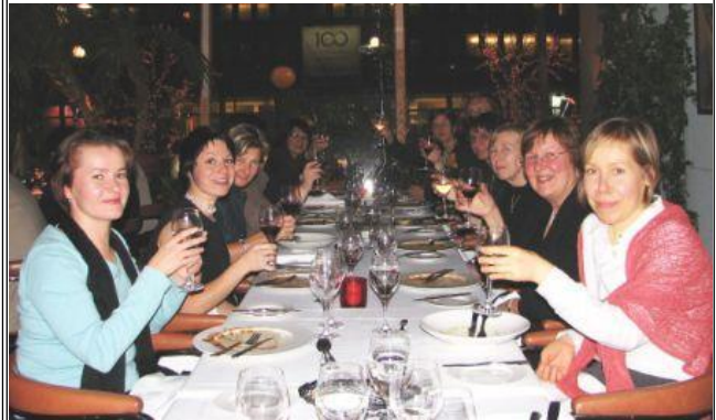
Juhlailillisella malja BMF:lle.